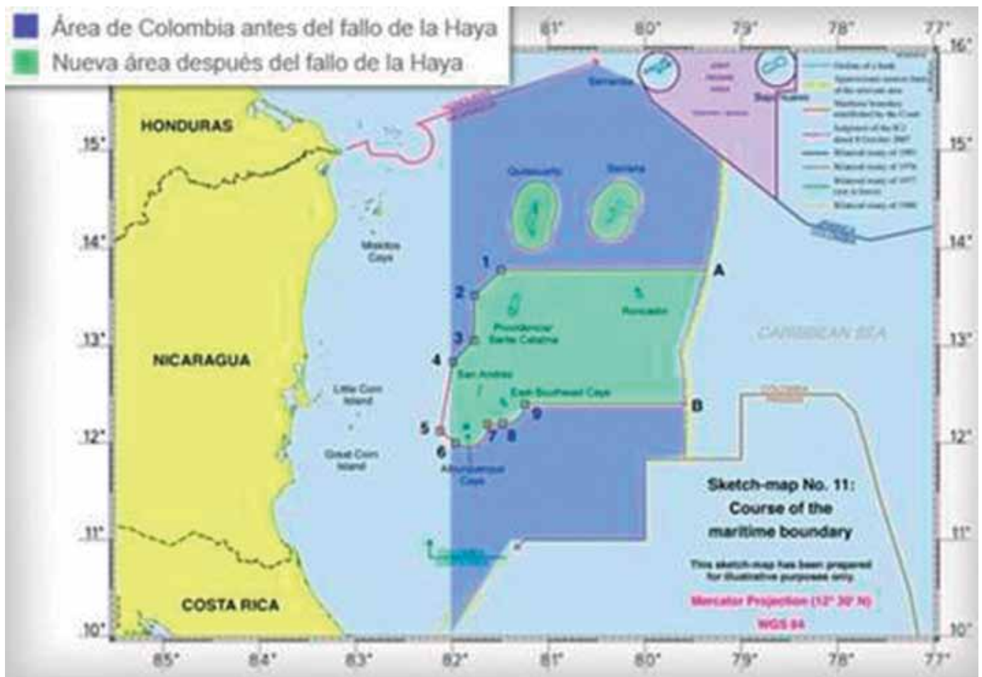
Imagen: Mapa elaborado por el tribunal internacional. En este mapa, se logra dimensionar los espacios marítimos que Colombia ha perdido en 1.928 (color azul marino claro y al oeste del meridiano 82) y 2.012 (color azul marino oscuro al este del meridiano 82), conservando únicamente las áreas marinas y submarinas coloreadas en color verde y todo el área al este de la línea AB.

por Colombia del meridiano 82 como límite entre los dos países aduciendo la nulidad del tratado que lo contemplaba bajo el entendido de que todas esas áreas marinas, submarinas e insulares adyacentes a sus costas le pertenecían ya que todas ellas forman parte de su plataforma continental, pero nunca éste conflicto versó sobre discutir o determinar cuál era el límite o frontera marítima y submarina entre Colombia y Nicaragua; aunque lo anterior puede sonar a tontería de Perogrullo y tintorería jurídica, tiene su capital importancia y es que Nicaragua, para fundamentar su primera demanda ante la Corte Internacional de Justicia de la Haya y en concreto la cuarta pretensión de que ésta corte procediera a fijar la frontera marítima y delimitar las áreas submarinas en subsidio y en caso de rechazo de las tres primera pretensiones, adujo que, precisamente, había una controversia entre los dos países sobre cuál era y cómo se limitaba la susodicha frontera marítima, lo cual cómo ya se explicó, nunca lo hubo ya que el conflicto era de otras características, las cuales se reiteran para mayor ilustración del lector, con-