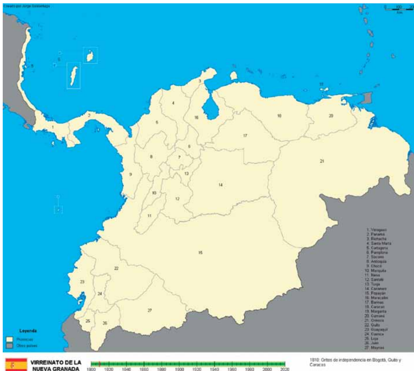
Imagen: Evolución territorial de Colombia. Mapa del Virreinato de la Nueva Granada para 1.810, nótese como el mismo llega hasta la costa Mosquitia y el Archipiélago de San Andrés y Providencia, razón por la cual Colombia colindaba (y aun colinda con Nicaragua)

Es por éstas consideraciones históricas de vecindad y de análisis juicioso del referido tratado de solución de límites territoriales, el cual prevalece sobre cualquier convención o norma jurídica internacional posterior en virtud del principio PACTA SUNT SERVANDA, que se podría concluir que hasta antes del fallo de la Corte Internacional de Justicia de la Haya, noviembre de 2.012, la República de Colombia tenía la propiedad, soberanía y jurisdicción de una gran parte de las aguas marítimas y zonas submarinas localizadas entre la Costa de Mosquitos y el Archipiélago de San Andrés y Providencia, pero de una forma inexplicable y contraria al texto del mismo trata-