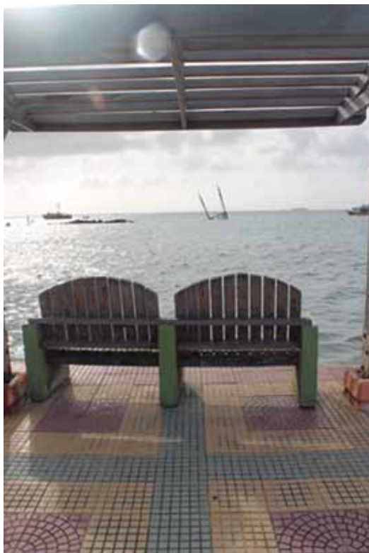
Sillas en malecón