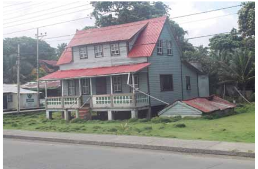
Casa típica de San Andrés