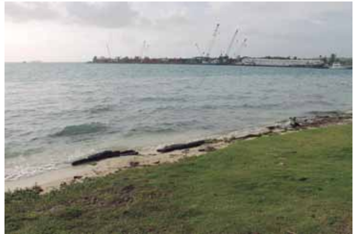
Puerto de San Andrés

Las imágenes de la sección Ríos y Mares de la revista LA TIMONERA, están protegidas por derechos de autor, y está prohibida su reproducción bajo cualquier medio sin previa autorización de la Liga Marítima de Colombia, o de su autor.