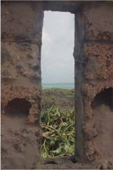
Vista al mar