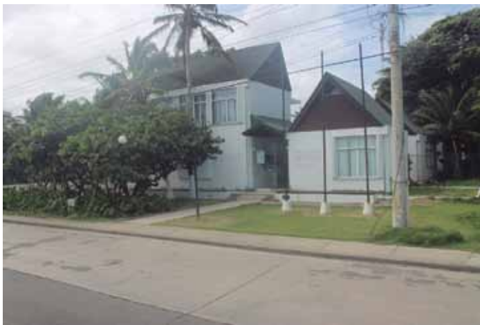
Universidad Nacional, sede San Andrés