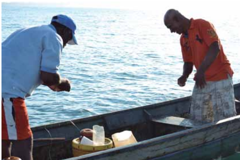
Foto: Pescadores.

La comercialización y venta de productos pesqueros no es ajena a esos retos y cambios en la dinámica y las lógicas de las nuevas cadenas de valor, y se enfrenta a un nuevo concepto del comprador final, del consumidor informado, del consumidor