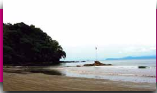
Imagen: Zona Exclusiva de Pesca Artesanal en el Pacífico.