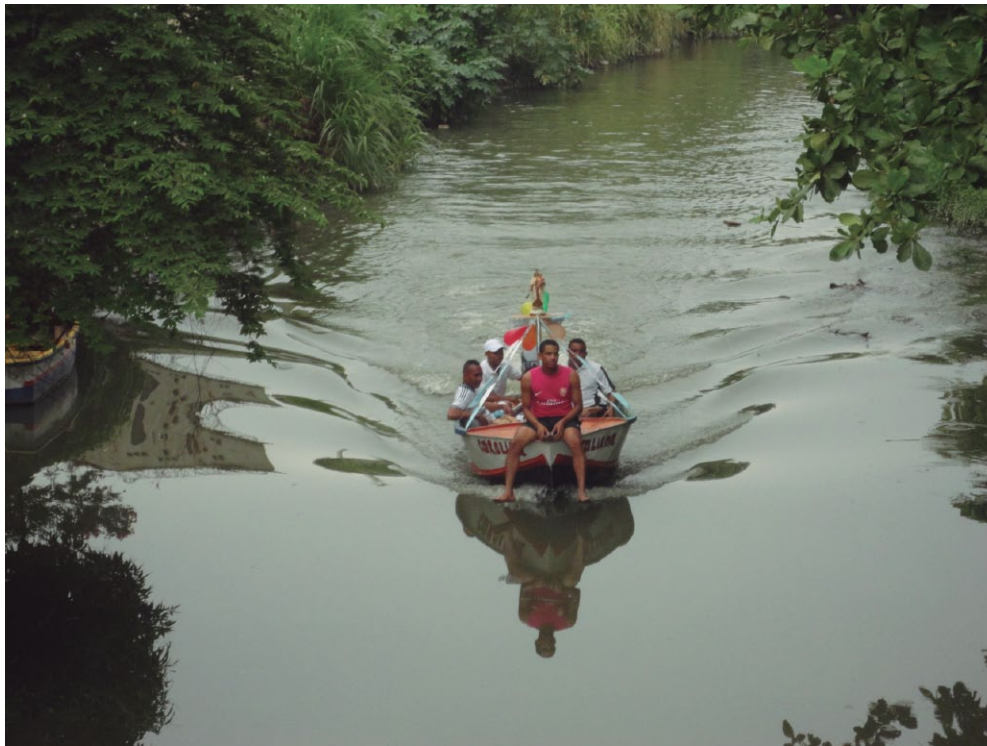
Imagen: Río Manzanares, Santa Marta. Por: Danny Ibarra

empresas públicas y privadas, Universidades y otros; quienes se han sentado a discutir acerca del futuro de esta importante fuente hídrica. A partir de estas mesas se concluyó que la problemática del río se debe abordar desde 4 áreas principales: Ambiental (científico), Económico (productividad), Gestión política y social, Educación Ambiental.