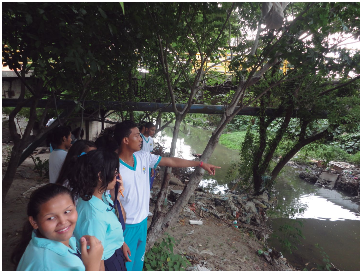
Imagen: Recorrido de reconocimiento ambiental y territorial, Río Manzanares, Santa Marta.

del vertimiento de aguas negras sin ningún tratamiento realizado por la empresa Metroagua; esta es la empresa encargada de prestar los servicios de acueducto y alcantarillado en el Distrito Turístico, Cultural e Histórico de Santa Marta. Este aporte genera malos olores en la zona y adicionalmente un aumento en la contaminación del agua del río, lo cual a su vez ha llevado a desencadenar problemas de salud como enfermedades estomacales y otros causados por la proliferación de mosquitos.