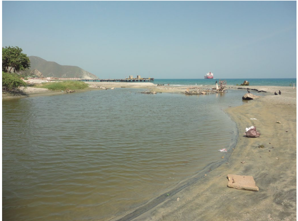
Imagen: Playa de los Cocos Santa Marta

res, ni por las entidades del estado, como se puede evidenciar en la construcción del batallón y del cementerio, aledaños al río; además que del 100% de las viviendas localizadas en el área de estudio, para el año 2002, solo un 21% ha sido construida de manera planificada, por otro lado el 79% restante de la urbanización se ha dado a manera de invasión (Universidad del Magdalena, 2002). Este crecimiento urbano descontrolado, en la ciudad de Santa Marta, ha violado la reglamentación y legislación ambiental existente, tomando terreno que pertenece al río Manzanares y su zona de amortiguación de crecientes, lo que no solo aumenta los riesgos de la población ante la crecida del río, sino que también afecta desde el punto de vista ambiental e hidráulico. De igual manera en la zona baja del río se ha pavimentado y construido en los humedales que constituían el plano inundable de este (Universidad del Magdalena, 2002).