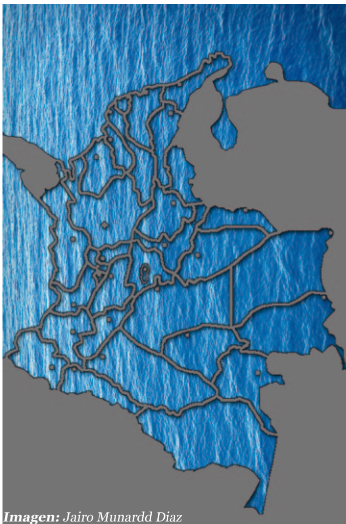
Imagen: Jairo Munardd Diaz

Palabras Clave: Mar, Desarrollo, DIMAR, Seguridad Integral Marítima, Pacto de los Océanos