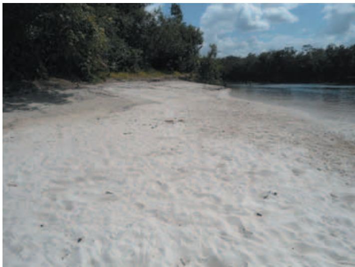
Playa Caño Bocon