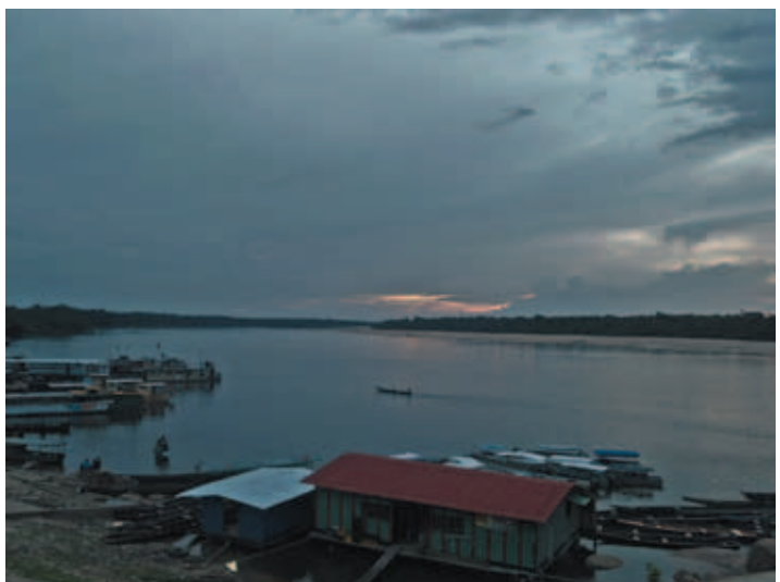
Puerto, Río Inrída