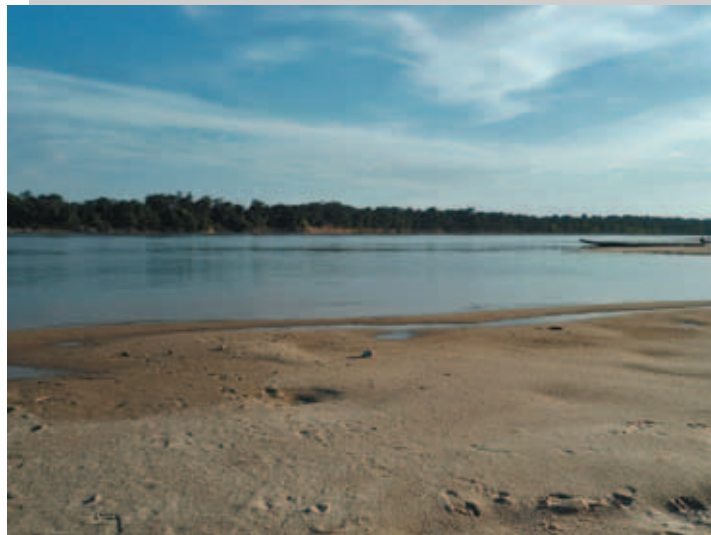
Playa Río Inirida