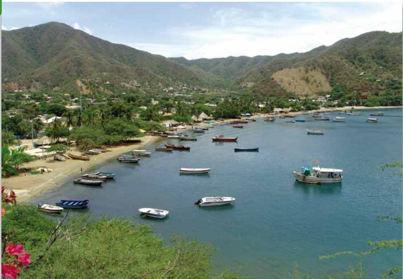
Imagen: Bahía de Taganga Santa Marta.