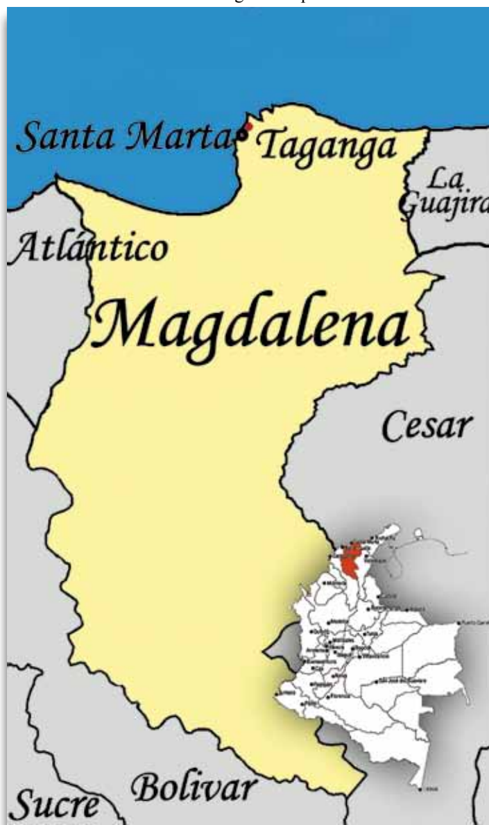
Imagen: Adaptación Jairo Munard D.

Igualmente, se estableció que hay una gran necesidad de evaluar el impacto ambiental de las actuales actividades humanas y monitorear el estado de los recursos marinos que están bajo la presión de la actividad turística. Además, se recomendó creación de alojamientos turísticos comunitarios, mejoramiento de la infraestructura, realización de estudios de viabilidad para aplicación de microcréditos y tasas por uso de bienes y servicios ambientales,