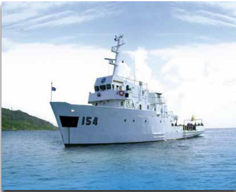
Fotos: Los Buques Oceanográficos ARC “Gorgona” y el ARC “Malpelo” con su personal especializado en hidrografía del Centro de Investigaciones Oceanográficas e Hidrográficas del Caribe (Cioh) y el Centro de Investigaciones Oceanográficas e Hidrográficas del Pacífico (Ccep), realizan los levantamientos hidrográficos que permiten obtener registros de las profundidades desde la superficie hasta el fondo marino.