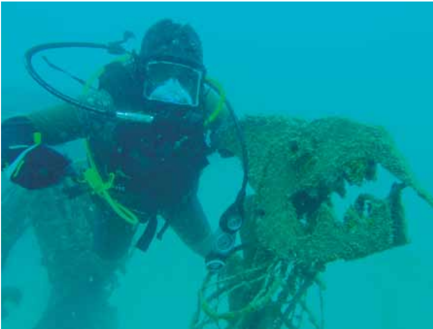
Imagen: Buzo recreativo en el parque temático junto a la serpiente marina “Estomía”, obra forjada por los estudiantes de la Escuela de buceo en la fase de soldadura submarina, proyecto que desde su inicio contribuyo notablemente al incremento de las actividades de buceo recreativo en Cartagena. Por: Buzo Maestro Manuel Forero Cubillos, Departamento de Buceo y Salvamento.

condicionado por el turismo ecológico subacuático, el aumento en la demanda de trabajos submarinos en la industria de la exploración, exportación de crudo, y de otras prácticas que requieren el trabajo del hombre bajo el agua. Por esta razón, los hombres de la Escuela de Buceo y Salvamento, son los más interesados en impulsar el desarrollo educativo para estas prácticas.