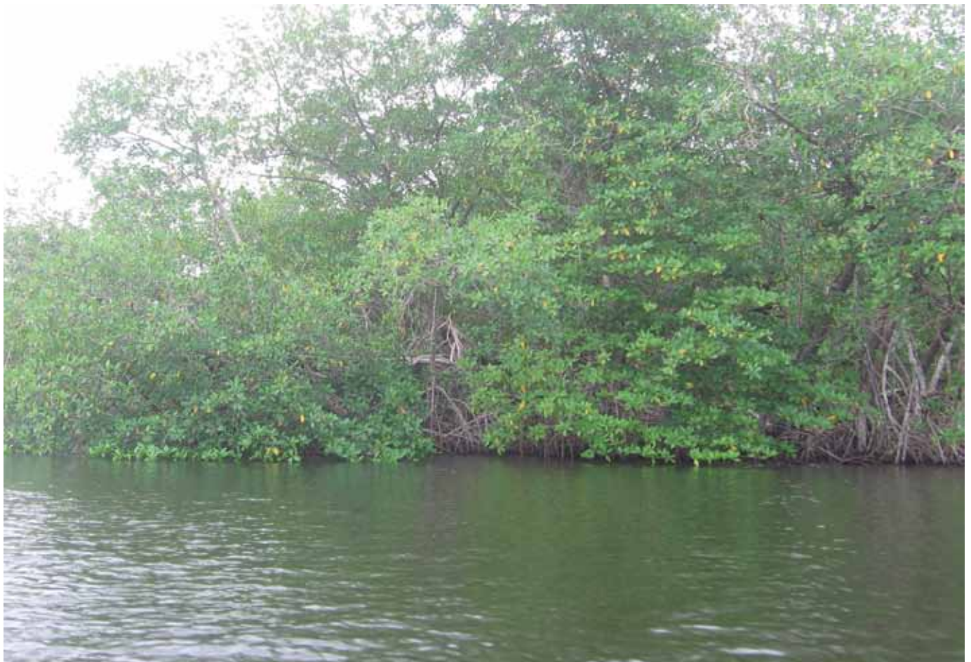
Imagen: Bahía Marirrío Por: Jairo Zapata.

Con un área de 18.16 km 2 aproximadamente y una profundidad promedio de 4 m, Bahía Marirrío (Figura 1), ubicada al suroccidente del Golfo de Urabá, es considerada como un es-