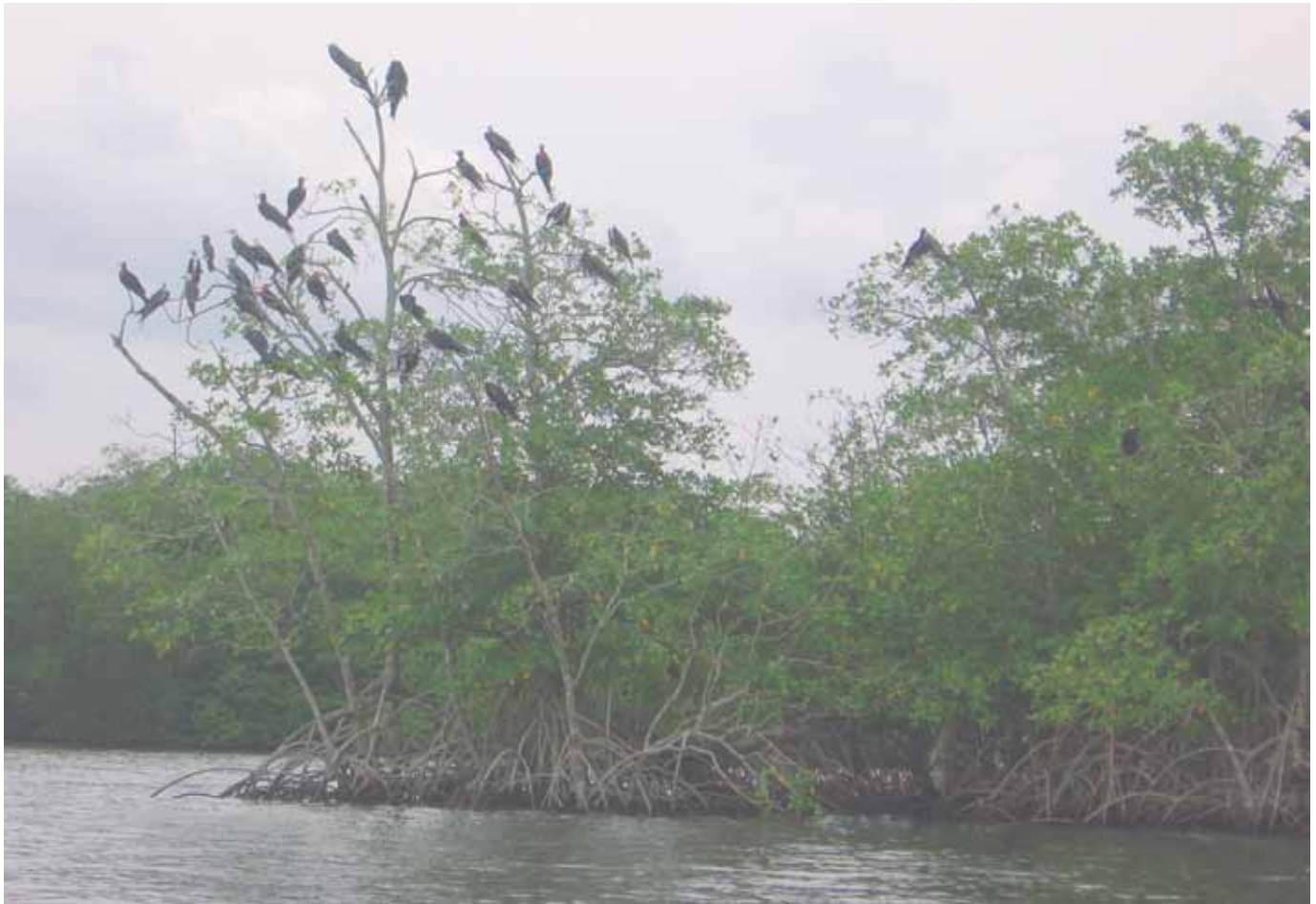
Imagen: Bahía Marirrí

tuarío mesohalino 1,2 , que constituye una zona protegida con una baja exposición al oleaje, siendo la zona que menor cantidad de agua dulce recibe, teniendo por lo tanto una mayor salinidad 3 encontrándose bordeada por bosques de manglar fundamentalmente de mangle rojo Rhizophora mangle que han colonizado numerosas y pequeñas islas resultantes de procesos sedimentológicos en la zona 4 , convirtiéndose en una importante área para la fijación de algunas larvas de moluscos bivalvos.