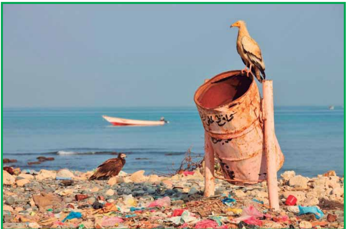
Imagen: La mala salud de los océanos, Hay cerca de 1.400 millones de kilómetros cúbicos de agua repartidos en 70,8 por ciento de la superficie del planeta. Cada año, treinta millones de toneladas de vida marina son capturados accidentalmente y asesinados. Con cada arrastre se reduce la salud del océano.

C olombia cuenta con 928.660 km 2 de aguas jurisdiccionales y aproximadamente 3000 km de costa donde arrecifes coralinos, bosques de manglar, praderas de pastos marinos, playas arenosas, entre otros juegan un importante papel en el equilibrio del sistema natural y su relación con la población. El país en los últimos años ha venido llevando a cabo grandes transformaciones que lo están