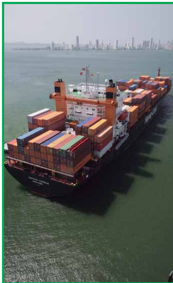
Imagen: Tráfico marítimo como uno de los indicadores del OHI.

El OHI se calcula a partir del promedio de los valores de 10 objetivos que representan los beneficios ecológicos, sociales y económicos claves que provee