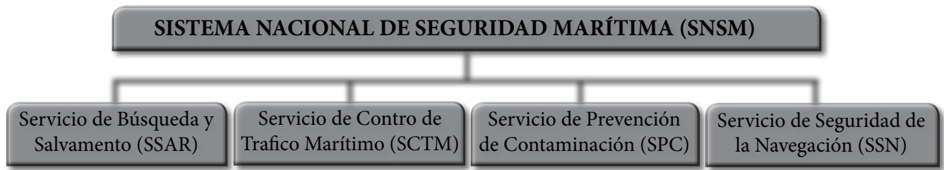
Imagen: (Fig 1) Organigrama de Sistema Nacional de Seguridad Marítima

el marco de un Sistema Nacional de Seguridad Marítima, el cual permitirá la utilización de medios de comunicación y control unificados facilitando el manejo de la información, la toma de decisiones y el seguimiento, control y apoyo a los buques de bandera y a los que naveguen en la jurisdicción,