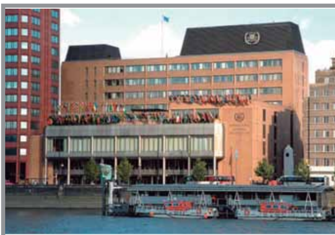
Imagen: Sede de la Organización Marítima Internacional, Londres. UK.