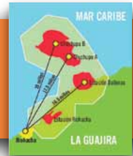
Imagen: Campos de gas. Guajira (Chuchupa, Ballena y Riohacha)