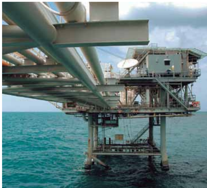
Imagen: Plataforma Chuchupa frente al departamento de la Guajira.

Al respecto la AGENCIA NACIONAL DE HIDROCARBUROS respondió, “En el marco de las funciones de la Agencia Nacional de Hidrocarburos previstas en el artículo 4 del Decreto 4137 de 2011, le informamos que para efectos de la contratación de áreas para la exploración y producción de hidrocarburos en áreas continentales y costa afuera, la normatividad aplicable es el Acuerdo 004 de 2012, emitido por el Consejo Directivo de la ANH y por el cual “se establecen los criterios de administración y asignación de áreas para exploración y explotación de los hidrocarburos propiedad de la Nación, se expide el Reglamento de Contratación correspondiente, y se fijan reglas para la gestión y el seguimiento de los respectivos Contratos”.