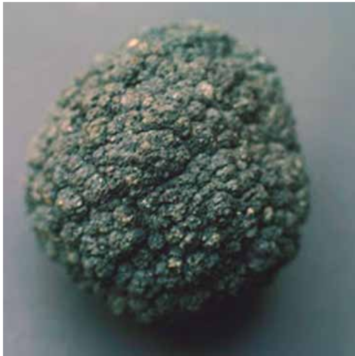
Imagen: Nódulo polimetálico, cuerpo rocoso de forma casi esférica compuestos por diversos minerales dependiendo del lugar en donde se encuentren. Son codiciados por su contenido de magnesio, níquel, cobre, cobalto, molibdeno, fierro y aluminio.

En concordancia, los artículos 181 y 182 ibidem, define el concepto de exploración costera y submarina, y exploración sísmica, y señala que cuando estos son desarrollados en las playas marítimas, en mar jurisdiccional o en la plataforma continental, requiere permiso de la Dirección General Marítima, previo concepto favorable del Ministerio de Minas y del Ministerio de Medio Ambiente y demás entidades que deban conocer el proyecto de investigación.