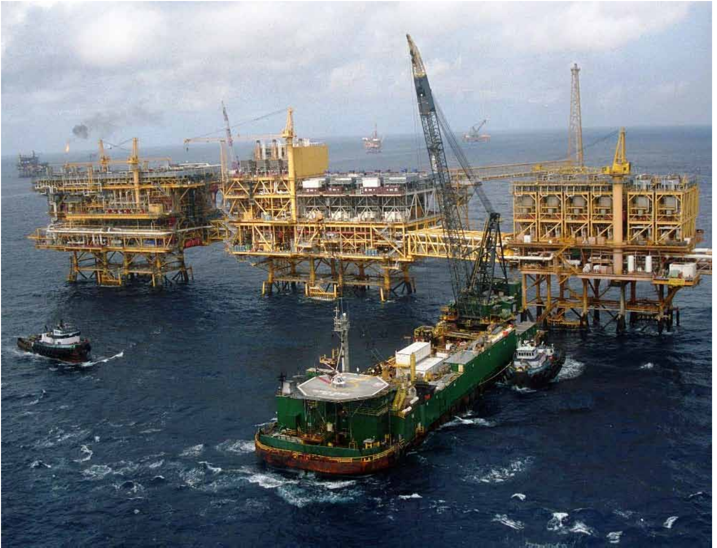
Imagen: Plataforma petrolífera.

regional, los sujetos pasivos de la tasa, entre otros aspectos.