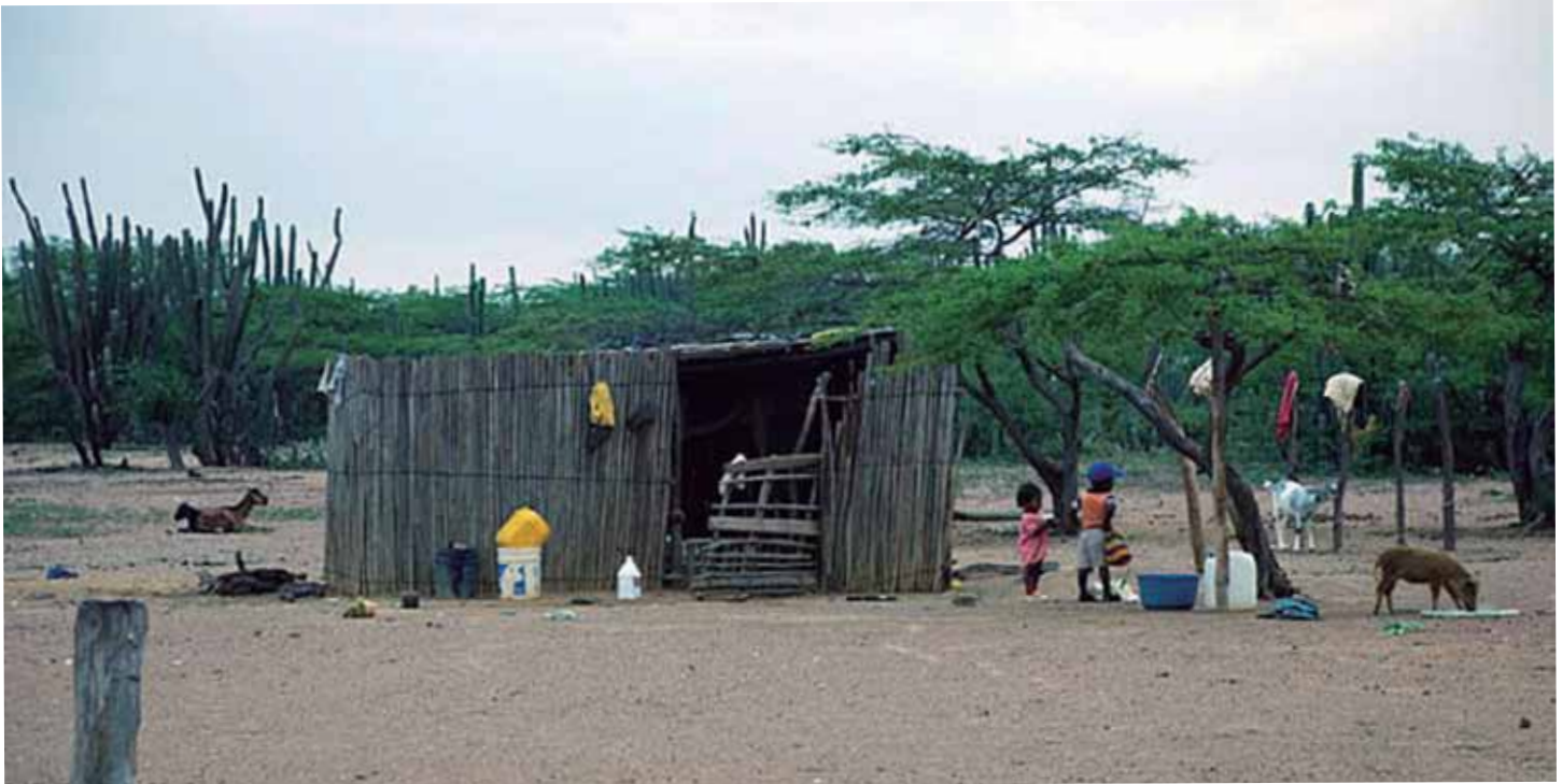
Imagen: Ley de regalías. Departamentos que recibieron entre 2004 y 2009 el 60% del total de regalías, como La Guajira, tienen los índices más altos de mortalidad infantil y niveles de pobreza e indigencia superiores al promedio nacional.

para suministrar información sobre el particular es el Ministerio de Ambiente y Desarrollo Territorial como organismo rector de la gestión de medio ambiente, sin embargo, se invita para la realización de su trabajo de investigación la consulta de las siguientes normas: