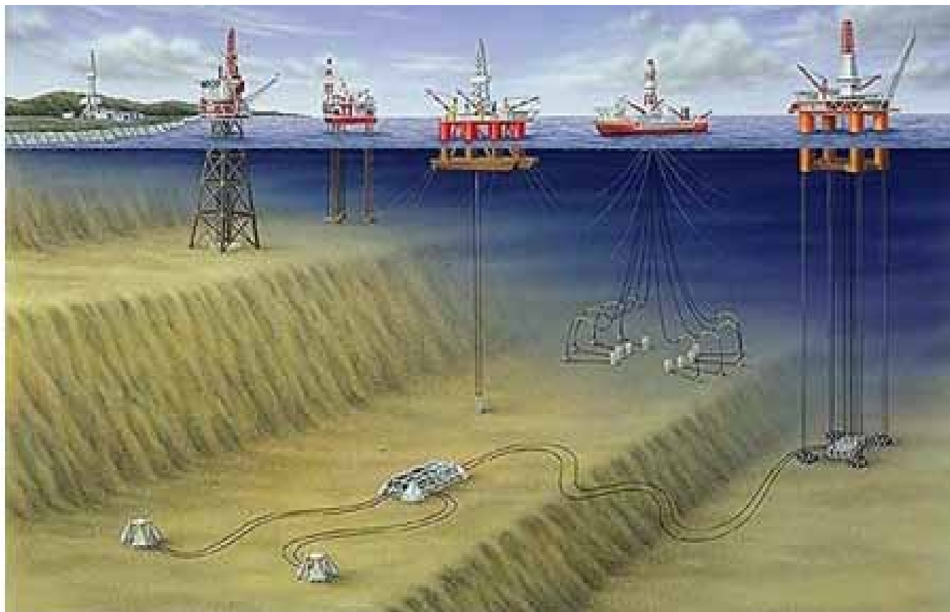
Imagen: Plataforma de perforación offshore.

El Ministerio de Minas y Energía manifiesta “que el tema no es de su competencia y que la solicitud debe ser gestionada ante el Honorable Congreso de la República”, donde además de quebrantar y enviarlo como es su deber simplemente se aparta de la pregunta solicitada.