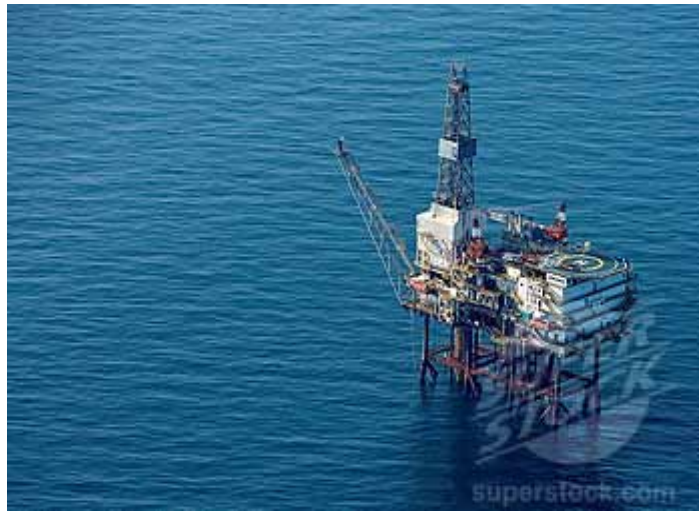
Imagen: Plataforma. Tomado de www.superstock.com

Parágrafo 1° En los sectores en los cuales no se encuentran establecidas las líneas de base recta, la zona marina se fijará entre la línea de la costa y hasta una línea paralela localizada a doce (12) millas náuticas mar