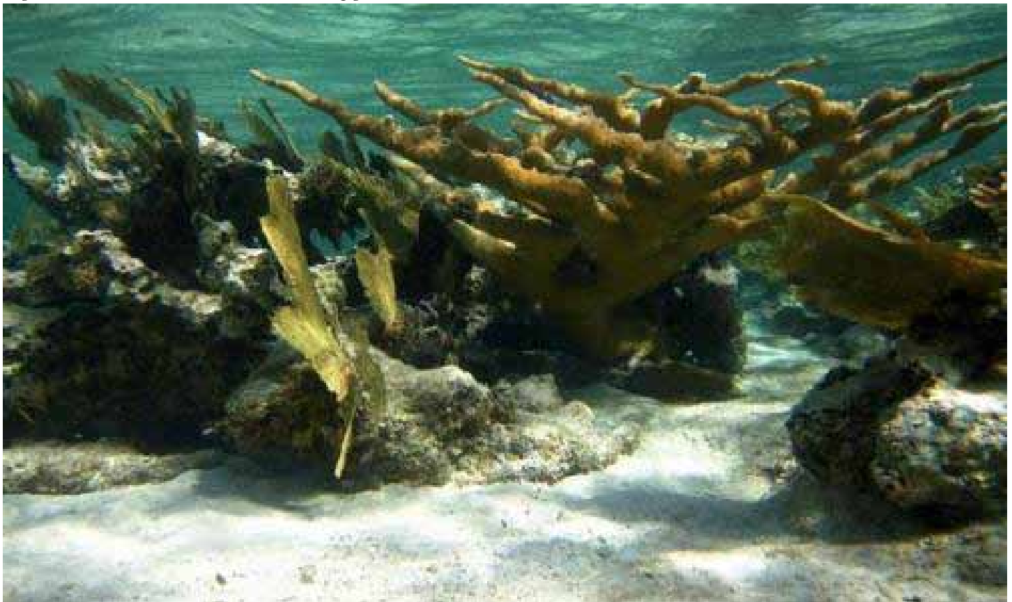
Imagen: Arrecifes de coral del Caribe que han dejado de crecer o comienzan a erosionarse. Fuente: Milenio País/Región: Caribe Tomado de http://noticias-ambientales-internacionales.blogspot.com

Parágrafo 1º. En arrecifes de coral y manglares se prohíbe el desarrollo de actividades mineras, exploración de hidrocarburos, acuicultura, pesca industrial de arrastre