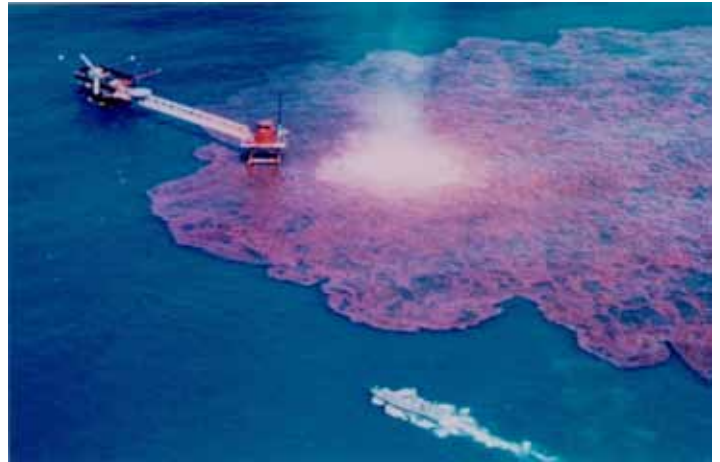
Imagen: Derrame de Petroleo

que los recursos hidrobiológicos, declaro a los manglares, estuarios, meandros, ciénagas u otros hábitats similares de recursos hidrobiológicos, como dignos de protección.