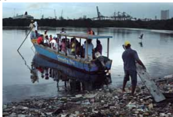
Imagen: Bazurto.