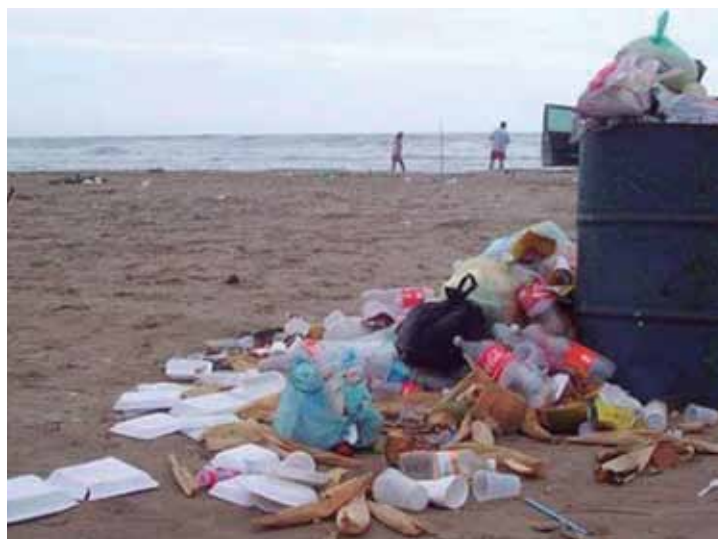
Imagen: Basura en las playas.

Lo anterior se puede evidenciar en las áreas costeras de Santa Marta y Ciénaga, donde en una misma ubicación se llevan a cabo no sólo actividades turísticas, sino también portuarias, de pesca, y que incluso existan áreas protegidas adyacentes con problemática similar.