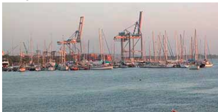
Imágenes: Terminaldecarbapuertodeveleros / Rellenos.