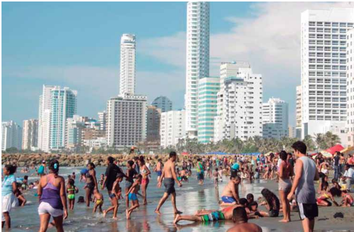
Imagen: Playas temporada alta.

Como resultado se observa un crecimiento desordenado del turismo, planificación pobre de la línea de la