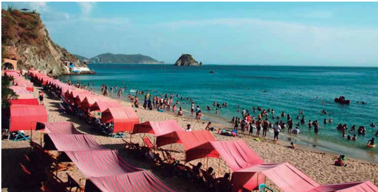
Imagen: Santa Marta. Obtenida de: Autor

como autoridad marítima local, de manera que asegure un desarrollo del territorio marítimo ordenado y coordinado de los diferentes sectores económicos con el medio ambiente y planes de desarrollo distrital.