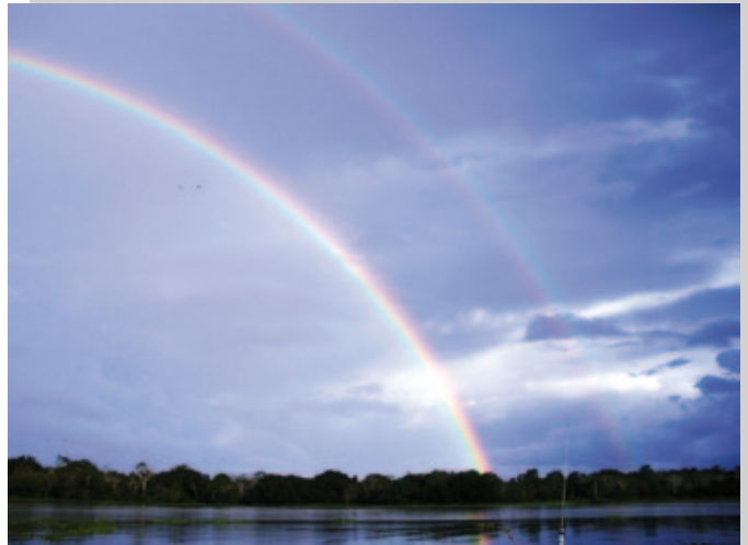
Malecón de Leticia Amazonas