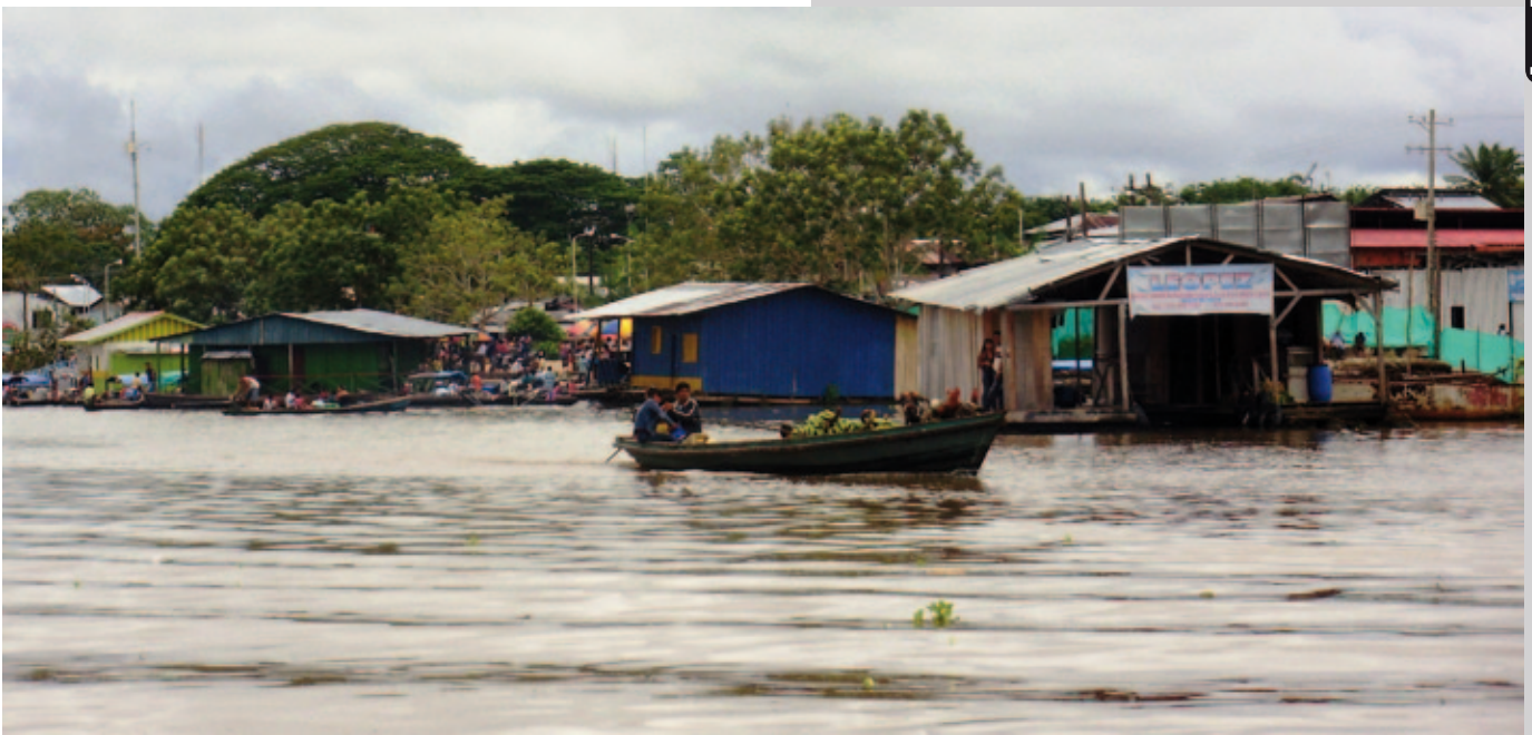
Puerto de Leticia