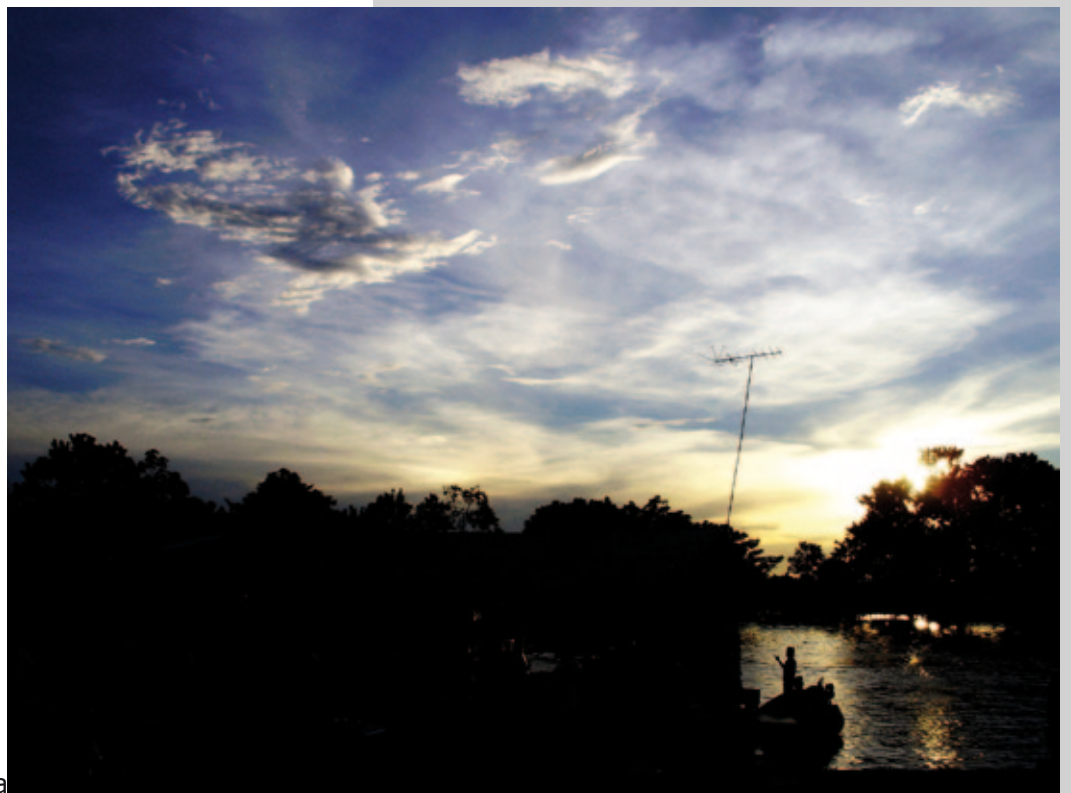
Malecón de Leticia