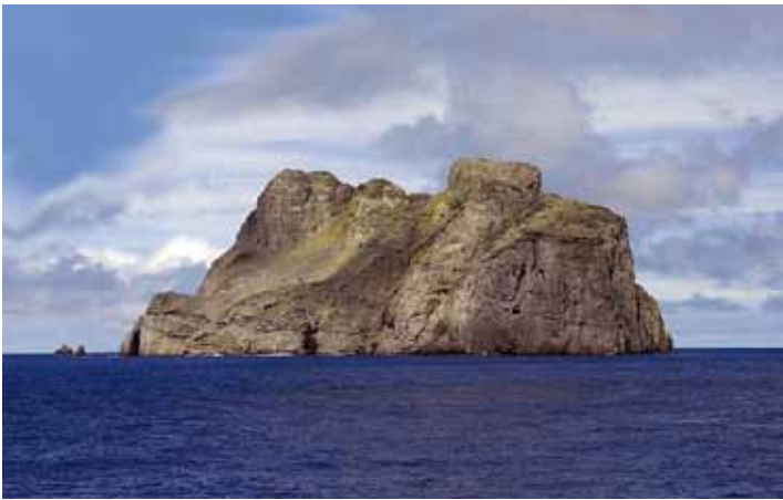
Foto: Isla Malpelo.

aspectos ecológicos de los ecosistemas que conforman la costa (Ej. acantilados, playas, manglares). También se encontraron trabajos sobre oceanografía y climatología como el Fenómeno de El Niño y La Niña, estudios sobre contaminación marina por aguas residuales, actividades mineras, derrame de hidrocarburos, aguas de lastre, entre otros. A nivel de normativa nacional e internacional, se han referenciado convenios internacionales, políticas nacionales con incidencia sobre los recursos del pacífico, Leyes, Decretos, Resoluciones y Acuerdos vigentes, así como estudios políticos que analizan la coherencia política de las diferentes normas y como se articulan entre los diferentes niveles. Vale la pena resaltar que el trabajo de recopilación de información ha incluido lo que comúnmente se llama "literatura gris" la cual por lo general es de muy buena calidad pero que no llega a publicarse oficialmente, y reposa en las entidades sin que sean conocidas a nivel nacional.