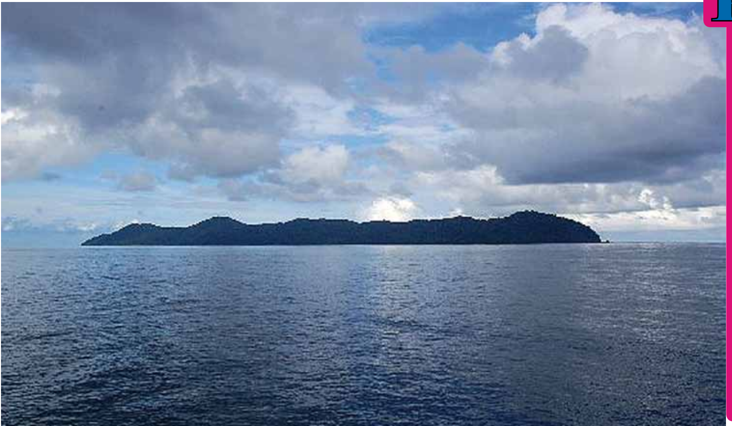
Foto: Isla Gorgona.