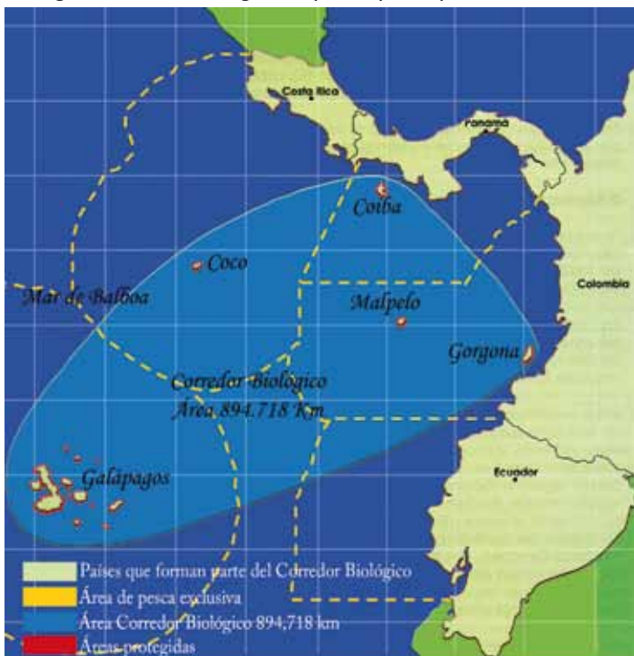
Imagen: Corredor Biológico Mapa adaptado por: Jairo Munard D.

aspectos ecológicos de los ecosistemas que conforman la costa (Ej. acantilados, playas, manglares). También se encontraron trabajos sobre oceanografía y climatología como el Fenómeno de El Niño y La Niña, estudios sobre contaminación marina por aguas residuales, actividades mineras, derrame de hidrocarburos, aguas de lastre, entre otros. A nivel de normativa nacional e internacional, se han referenciado convenios internacionales, políticas nacionales con incidencia sobre los recursos del pacífico, Leyes, Decretos, Resoluciones y Acuerdos vigentes, así como estudios políticos que analizan la coherencia política de las diferentes normas y como se articulan entre los diferentes niveles. Vale la pena resaltar que el trabajo de recopilación de información ha incluido lo que comúnmente se llama "literatura gris" la cual por lo general es de muy buena calidad pero que no llega a publicarse oficialmente, y reposa en las entidades sin que sean conocidas a nivel nacional.