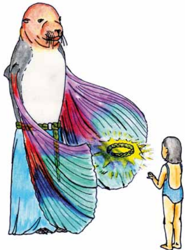
MARIANA Y EL MAR (JMUNARD)

Es aquí en donde nos encontramos con que frente al mar existen unas actitudes diferenciadas ya sea por