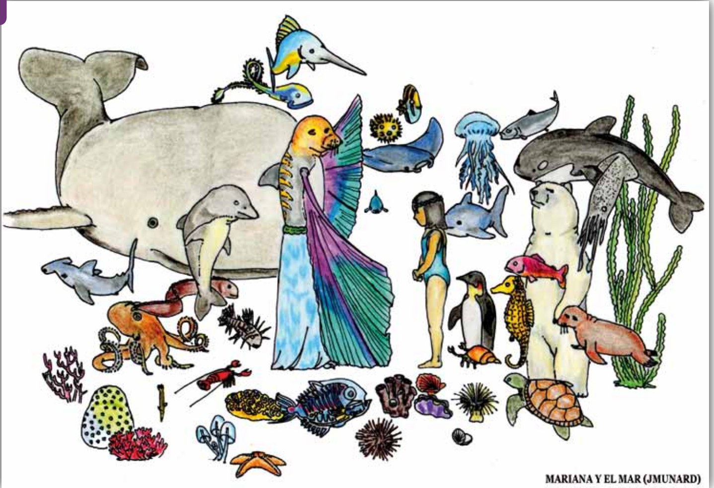
MARIANA Y EL MAR (JMUNARD)