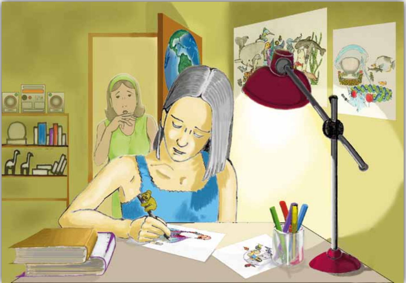
Ilustración: Jairo Munard Diaz

que fueron enseñadas de manera espontánea o porque lo fueron de manera intencional. En educación generalmente se desarrollan procesos de formación intencionados, bien podría entonces plantearse esta como un medio para desaprender aquello que hace daño al mar y aprender lo que le beneficia desde lo consciente e inconsciente.